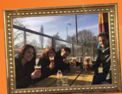
Op de foto: The Dirty Denims op het PopEi terras Jouw foto in deze lijst? Check: www.popei.nl/de-popei

Check www.lostctrl.nl voor een overzicht van alle optredens