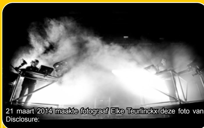
21 maart 2014 maakte fotograaf Elke Teurlinckx deze foto van Disclosure:

"Op de foto zie je de Engelse jonge broertjes 'Lawrence' die op dat moment spelen voor een uitverkochte show in het Klokgebouw. Alle nummers werden zelf gespeeld door de mannen."