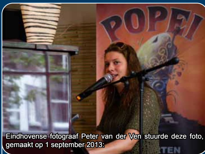
Eindhovense fotograaf Peter van der Ven stuurde deze foto, gemaakt op 1 september 2013:

"Mijn afsluiting van een dag Hallo Cultuur met een intiem optreden in De Oude Rechtbank. Een verrassende setting, met een voor mij verrassend optreden van Joyce Deijnen."